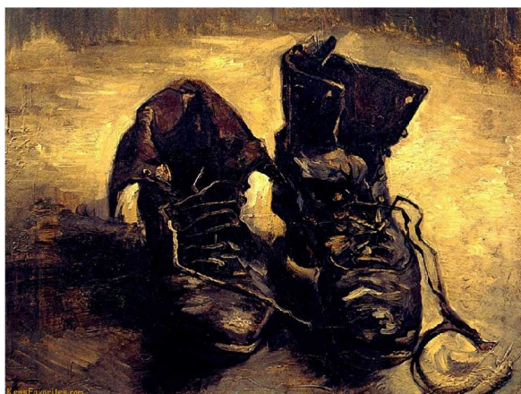
Um par de sapatos. Van Gogh, 1885.

Aparentemente, pôr-se diante de um apetrecho não ajudará a esclarecer o que é o ser-apetrecho do apetrecho. Isto porque não se depreende a utilidade do apetrecho apenas postando-se diante dele. No entanto, completando o círculo, Heidegger nos mostra como este pôr-se diante do apetrecho pode fazer vir à luz o ser-apetrecho do apetrecho, a utilidade que repousa na sua solidez ( A origem da obra de arte , pp. 25-26):